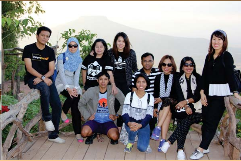
3 วัน 2 คืน ณ เชียงคาน กับมิตรภาพยาวนานของเรา...หน่วยประสานงานมหาวิทยาลัยวลัยลักษณ์ กรุงเทพมหานคร และสำนักงานสภามหาวิทยาลัยวลัยลักษณ์

เพราะอยากสลัดความตึงเครียดของสังคมเมืองออกไปจากหัวสั กพัก พวกเราจึงเดินทางมาที่นี่ เพื่อสัมผัสกับบรรยากาศและกลิ่นไ อความเป็นท้องถิ่น ที่ไม่ว่าจะมองไปทางไหนก็พบเจอแต่ความสวยงาม และเรื่องราวที่น่าประทับใจ จนอดไม่ได้ที่จะคาดหวังว่า นี่จะเป็นการ เดินทางที่คุ้มค่าและน่าจดจำครั้งหนึ่งของชีวิต