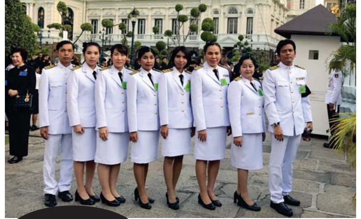
WU BKK TEAM